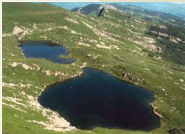
Parco dei Cento Laghi, i laghi del Sillara

■ Il Parco Regionale Cento Laghi , occupa la porzione dell'Appennino parmense orientale, corrispondente all'alta Val Cedra ed alta Val d'Enza. Il territorio è piuttosto variegato e si passa da un dolce paesaggio agricolo, ad una copertura boschiva più densa, interrotta a tratti da pascoli nelle parti più alte.