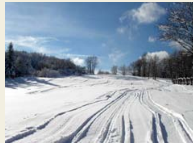
Schia, le piste da sci

■ L'ultima meta montana dell'Appennino Est inserita in itinerario è quella del Parco Provinciale del Monte Fuso . Da Tizzano occorre ritornare sulla Sp 665 e raggiungere Lagrimone. Qui lungo una strada