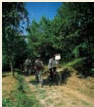
Monte Fusso, escursioni in mtb

■ Là dove osano le aquile. Il versante parmigiano dell' Appennino Tosco Emiliano è sicuramente il più spettacolare: panorami mozzafiato, laghi, praterie, faggete e un crinale che collega tutte le vette. È il regno della natura. Qui sono di casa il lupo, il capriolo, il cervo, il falco pellegrino e appunto l'aquila reale. Una tale ricchezza è giustamente tutelata: tutta l'area orientale, compresa tra il Passo della Cisa, fino al confine con la provincia di Reggio Emilia è protetta da due Parchi, il Parco Nazionale dell'Appennino Tosco Emiliano e il Parco Regionale dei Cento Laghi.