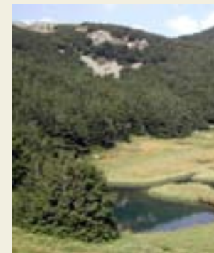
Parco Nazionale, torbiera

semplici, ma di grande pregio naturalistico, possono essere percorsi con partenza ed arrivo al rifugio. Altri portano alle aree più alte e ai laghi di