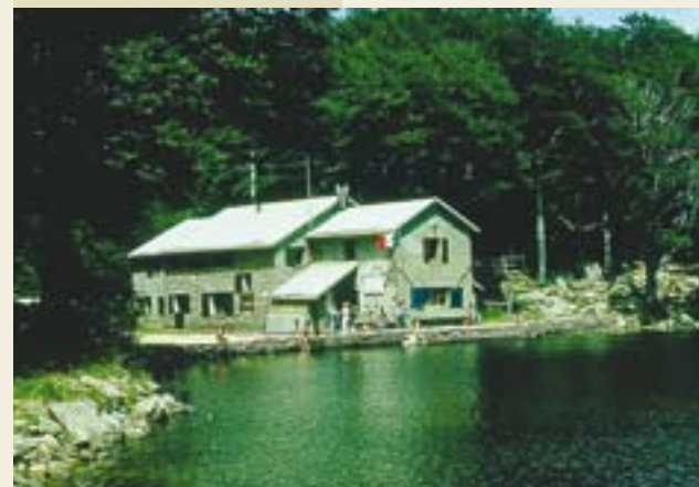
Lago Santo, il rifugio Mariotti

E' il più vasto lago di origine glaciale dell'Appennino Settentrionale. Situato a 1507 m di altezza, è raggiungibile da Lagdei, la Conca dei Laghi, un tempo occupata appunto da un antico lago, attraverso comodi sentieri oppure in seggiovia. Nelle vicinanze del lago è presente il Rifugio Mariotti dove si può trovare ristoro e possibilità di pernottamento.