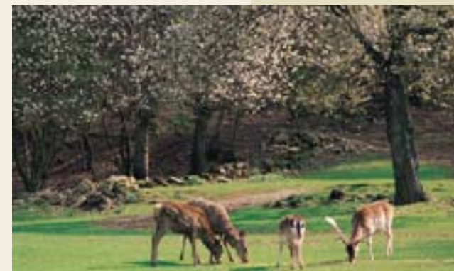
Monte Fuso, il Parco

Ci sono 75 km di piste studiate specificamente per la Mountain Bike attorno al Monte Fuso. Sono stati infatti individuati tre percorsi a difficoltà crescente, ciascuno connotato da un colore, che fanno del parco ora una delle mete preferite dagli appassionati della disciplina. Ma il Parco è attrezzato anche per altre attività, sportive e didattiche, come l'orienteeing, il tiro con l'arco e l'equitazione.