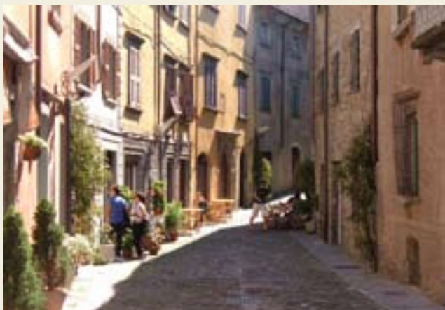
Berceto, strada Romea

■ La via più breve per accedere alla zona alto appenninica è quella che parte da Berceto . Il casello autostradale sulla A15 permette di raggiungere in pochi minuti la località montana posta sulla strada del passo della Cisa. Ubicata sulla Via Fran-