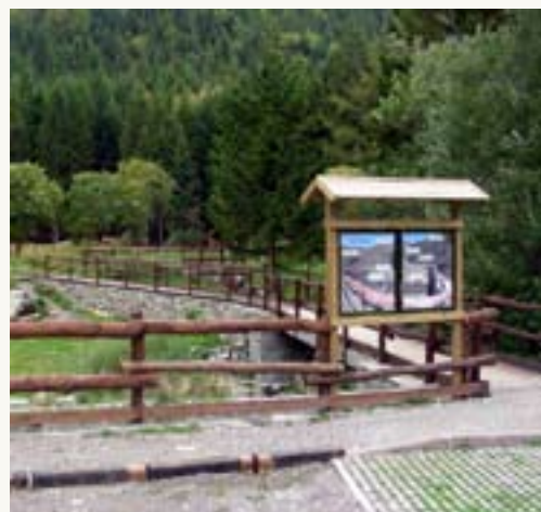
Lagdei, in alto il Lago Santo