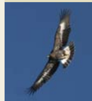
Parco dei Cento Laghi, giovane aquila

Gli antichi ghiacciai che occupavano le vallate dei torrenti Parma e Cedra hanno modellato il territorio. Nell'Alto Appennino si sono formati così ambienti unici (torbiere e laghi di crinale): fino a 1500 m domina il bosco di faggio, poi subentrano le brughiere. Ricca la fauna, a cui da qualche anno si è aggiunta l'aquila reale che nidifica su speroni rocciosi.