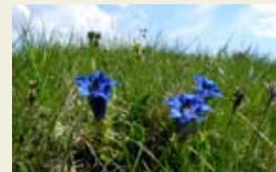
Parco Nazionale, genziane